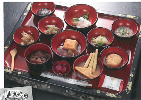
特製クリアファイル

平成30年、羽黒山三神合祭殿再建200年を記念して、この仏像5軀を羽黒山頂儀式殿にて公開することになりました。