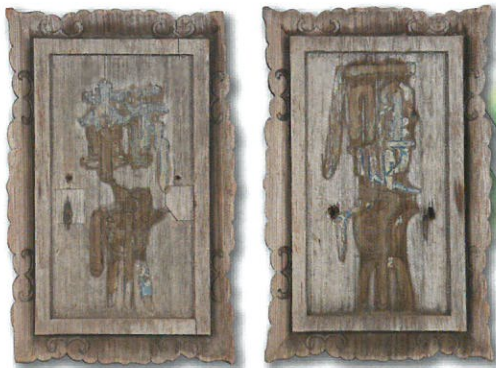
小野道風筆と伝える報身(正面・西)、応身(右・西)の額