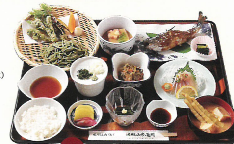
要予約 仙人膳 2,420円(税込)

お食事 季節の山菜やきのこなど旬の食材を使用した、自然の恵みを味わう精進料理です。