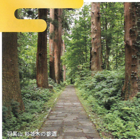
羽黒山 杉並木の参道