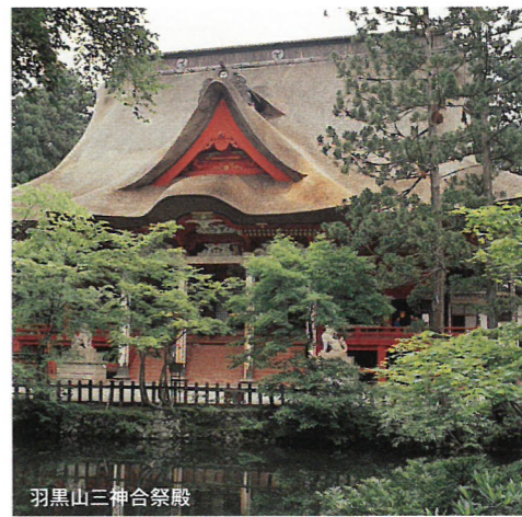
羽黒山三神合祭殿